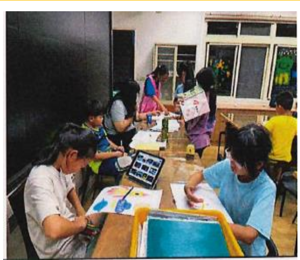
任課老師與助理教師一同協助輔導學童完成當天課業