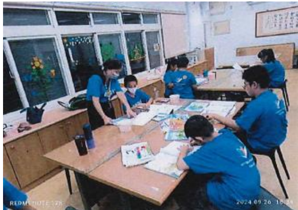
任課老師與助理教師一同協助輔導學童完成當天課業