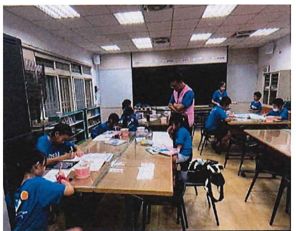
任課老師與助理教師一同協助輔導學童完成當天課業